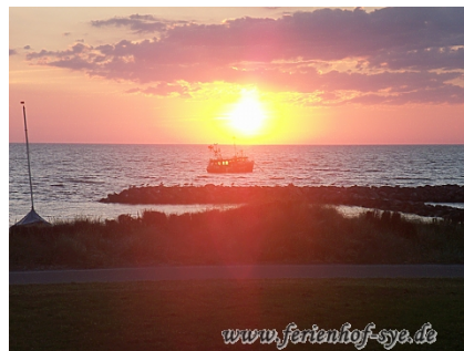
Sonnenaufgang am Schönberger Strand

Kurzzeitzuschlag bei weniger als 6 Nächten für Endreinigung 30,- Eur. Stromverbrauch wird am Ende abgerechnet. Bettwäsche u. Handtücher inkl. Brötchenservice Haustiere nach Absprache willkommen Reiten für Kinder 1 mal täglich inkl. Bei Belegung der Ferienhäuser mit 2 Personen außerhalb der Hauptsaison Preise auf Anfrage