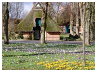
Dorfanger in Barsbek